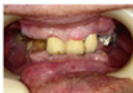
歯周炎は歯の欠損など様々な障害を誘発します。

基本的にはこのようなくみになります。ただ、障害をお持ちの方に限っては、通常の病院受診同様に取り扱いとなります。また、よく御問い合わせ頂く事をいくつか掲載させていただきますので、ご参照下さい。