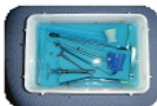
消毒液につけている機材