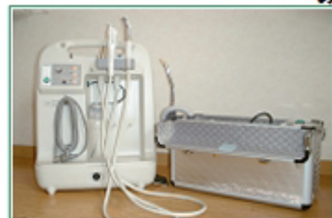
左からポータブルユニット、バキューム

スやベッドの横に置くことができ、楽な姿勢での治療が可能になります。また、トレイやコップ、ゴミ箱、ティッシュに至るまで当院で全て持参いたしますので、ご自宅にお伺いした際には水道とコンセントだけお借りできれば診療を行うことが出来るようになっております。この他にもレントゲンや、入れ歯を削るモーター等、全て持ち運びが可能な機材をご用意しておりますので、ご自宅でも医院と遜色ない治療が可能となっております。