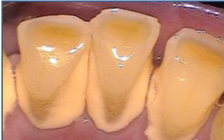
歯周ポケットに歯垢と歯石が付着した状態