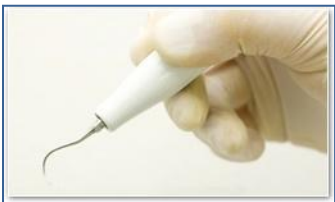
※超音波スケーラー 先端が微振動を起こし歯石を粉々に分解します

歯垢→歯ブラシでの除去可能 歯石→歯ブラシでの除去は不可能 専用器具での除去が必要